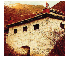
The "Temple Of Miraculous Fire" at Muktinath, Nepal. Photo by Ken Street (November 1979).

[For more on this subject, please read our tract The Temple Of Miraculous Fire. ]